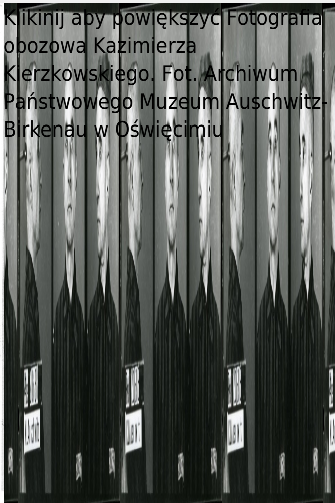
Fotografia obozowa Kazimierza Kierzkowskiego. Fot. Archiwum Państwowego Muzeum Auschwitz-Birkenau w Oświęcimiu

Kliknij aby powiększyć Fotografia obozowa Kazimierza Kierzkowskiego. Fot. Archiwum Państwowego Muzeum Auschwitz-Birkenau w Oświęcimiu