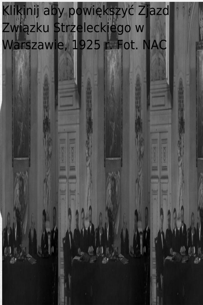
Zjazd Związku Strzeleckiego w Warszawie, 1925 r. Fot. NAC

Kliknij aby powiększyć Zjazd Związku Strzeleckiego w Warszawie, 1925 r. Fot. NAC