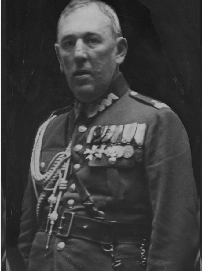
Gen. Bernard Mond. Fot. NAC

Kliknij aby powiększyć Gen. Bernard Mond. Fot. NAC