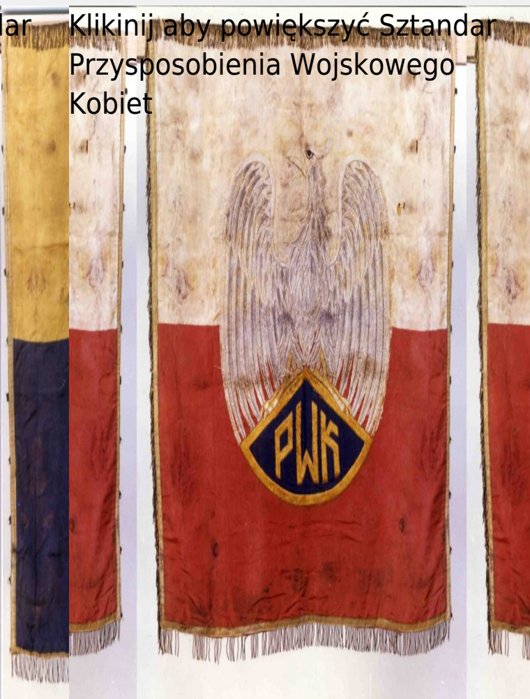
Sztandar Przysposobienia Wojskowego Kobiet

Kliknij aby powiększyć Sztandar Przysposobienia Wojskowego Kobiet