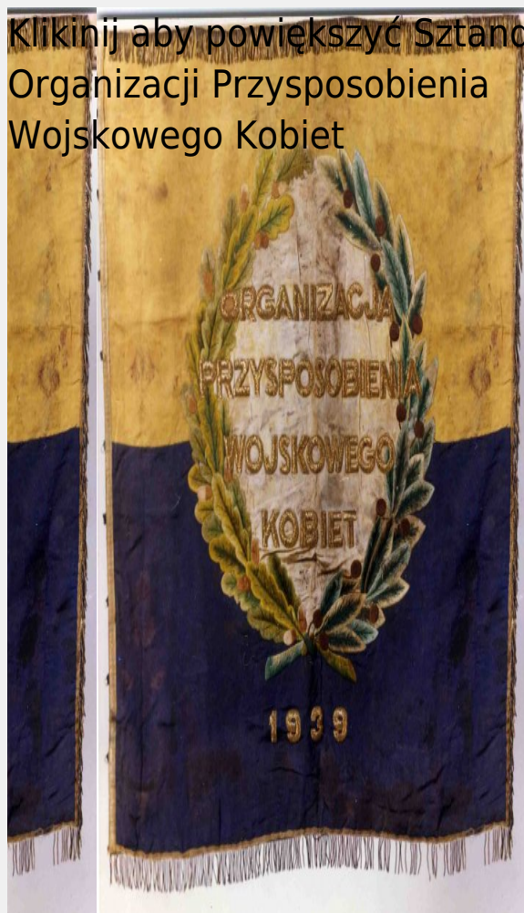
Sztandar Organizacji Przysposobienia Wojskowego Kobiet

Kliknij aby powiększyć Sztandar Organizacji Przysposobienia Wojskowego Kobiet