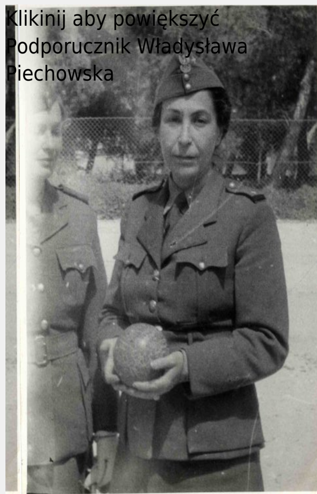
Kliknij aby powiększyć Podporucznik Władysława Piechowska

Kliknij aby powiększyć Relacja z przebiegu służby wojskowej Władysławy Piechowskiej we wrześniu 1939 r. #1