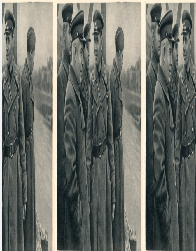
Українського фронту Н. С. Хруща у реві Сан (29 вересня 1939 р.)